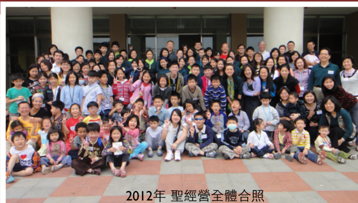
2012年 聖經營全體合照

感謝慕真家庭回覆名信片,並不斷給協會同工們打氣。歡迎您繼續以電子信箱提供您寶貴的意見。